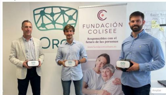
La Fundación Coliséé y Oroí Wellbeing colaboran en una iniciativa para ofrecer experiencias inmersivas en 3D a personas mayores.